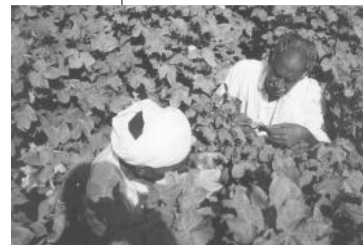
Des agriculteurs recherchent des aleurodes et leurs parasites sur le dessous des feuilles – formation sur le coton dans un champ-école pour agriculteurs (FFS) au Pakistan.

Des ressources financières et des efforts considérables ont été investis dans le développement de systèmes de lutte intégrée pour le coton. Mais la lutte intégrée réussit quand les chercheurs, les