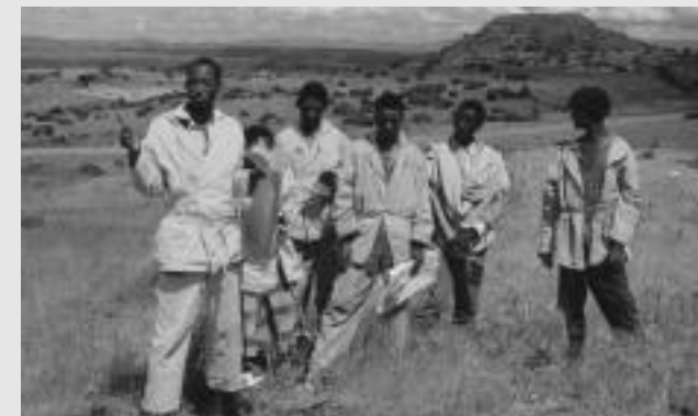
Des membres du Champ-école pour agriculteurs de Debeke discutent de méthodes d'observation des ravageurs dans leurs champs de teff.

De nombreux décideurs supposent que l'augmentation des quantités de pesticides utilisées dans les petites exploitations agricoles devrait produire des bénéfices substantiels.