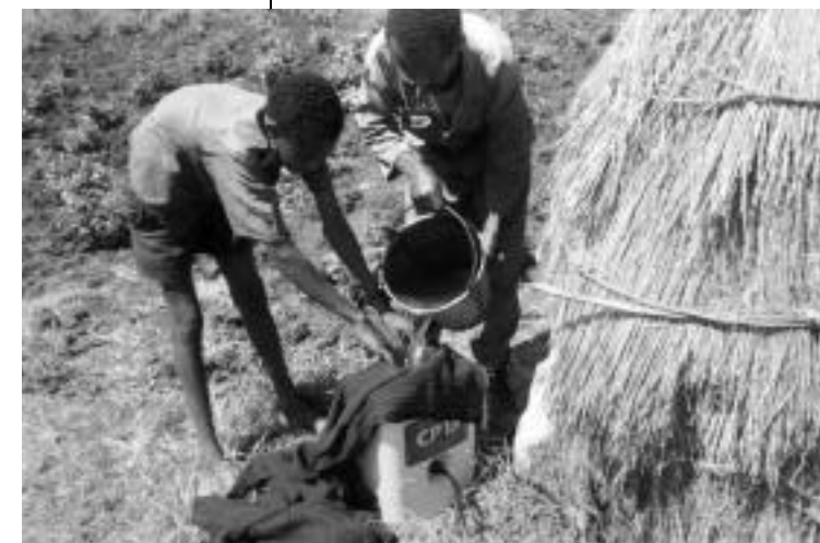
Un agriculteur éthiopien et son fils en train de mélanger des pesticides toxiques, sans protection.

L'Éthiopie est un pays où l'intensification de l'agriculture dans les petites exploitations, pour améliorer la sécurité alimentaire, a été vivement encouragée. L'Éthiopie est un des pays les plus pauvres du continent africain, et souffre de sécheresses répétées ; en 2000, le taux de malnutrition chez les enfants de moins de 5 ans a atteint 47 %. Le programme Sasakawa Global 2000 a été lancé en 1993, pour transformer l'agriculture de