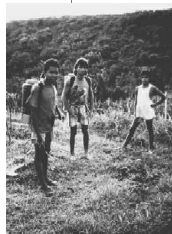
Niños aplicando pesticidas peligrosos

La importancia del tomate en muchas de las dietas nacionales y los altos niveles de uso de plaguicidas, crean preocupaciones acerca de la salud y la seguridad de los trabajadores, los cultivadores de menor escala, y de los consumidores.