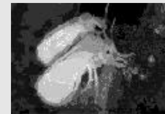
Bemisia tabacci adultos (Ian D. Bedford)

infestaciones pueden matar la planta. Los minadores de hoja que atacan al tomate, son la larva de pequeñas moscas que 'minan' la hoja taladrándola y comiéndose los tejidos entre las capas