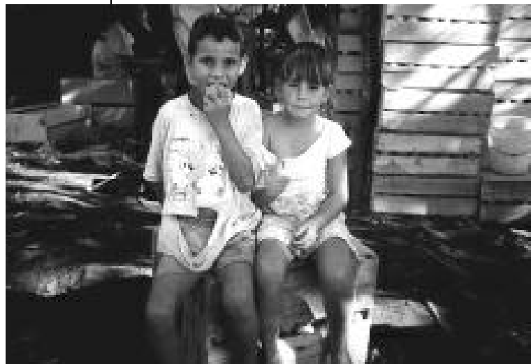
Los tomates contienen altos niveles de residuos de plaguicidas prohibidos

Se puede disponer fácilmente de más métodos de producción sostenible, pero no ha habido mayor