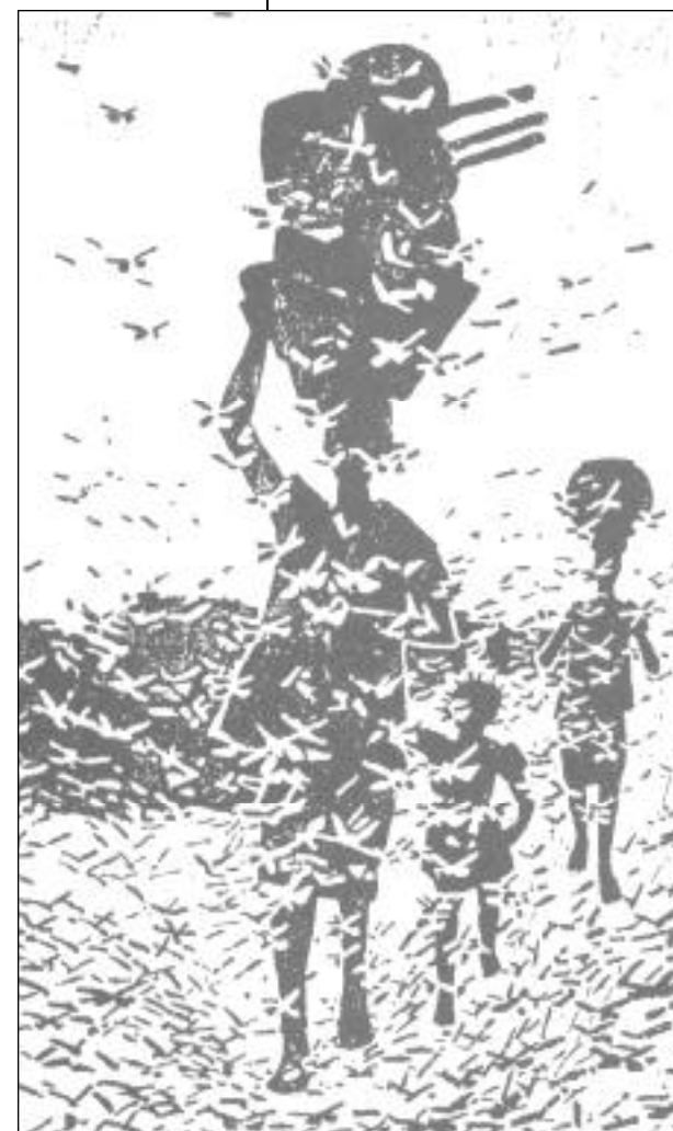
Enjambre de langostas: dibujo por cortesía de CIRAD, Francia.

Este cuadro panorámico tiene por objeto relacionar a los funcionarios de la Comisión, las delegaciones y los asesores políticos con las cuestiones pertinentes al control de la langosta del desierto. Examina la investigación actual y los aspectos que preocupan a los donantes y a los países afectados por la langosta.